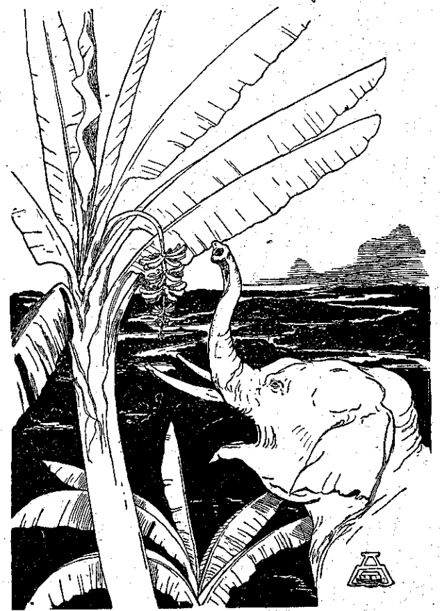
ΝΑ! ο' αυτή την εικόνα είνε το Έλεφαντόπουλο που παε να τραβήξη και να κόψη μπανάνες από ένα μπανανόδενδρο, αφού απέκτησε την όραση του καινούργια μακρυνά προβοσκίδα. Δεν μου φαίνεται να είνε πολύ ωραία εικόνα: αλλά δεν ήμπορεσά να την κάμω καλλίτερη, διότι οι έλεφαντες και οι μπανάνες είνε δύσκολα στο ζωγράφιμα. Τα πράγματα που είνε σαν φέτες-φέτες πίσω απ' το Έλεφαντόπουλο, σημαίνουν τόσους με έλη και με τέλματα κάπου στην Άφρική. Το Έλεφαντόπουλο έχαμε τα περισσότερά του λαοσκοπούλου με τη λάσπη που εβρισκεν εκεί. Νομίζω πως θά φαίνεται καλλίτερα, αν χρωματίσετε πράσινο το μπανανόδενδρο και κόκκινο το Έλεφαντόπουλο. — Σημείωσις του Συγγραφέως.

μυλλιαρός ο θεός του, ο Μπαμπούνιος. — Φαίνεται, είπε το Έλεφαντόπουλο. Αλλά είνε πολύ χρήσιμη.